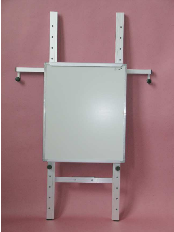
Abb. zeigt B-Halterung mit Kassette Illustration shows B-mounting with cassette

Die Kassetten-Halterungen Typ B + W eignen sich ausgezeichnet für Röntgenaufnahmen ohne Laufraster. Sie sind aus hochwertigem, eloxiertem Aluminium gefertigt und zeichnen sich durch hohe Stabilität, verbunden mit einem geringen Gewicht von nur ca. 2,5 kg aus. Im Gegensatz zu den R-Halterungen ist bei den B + W- Halterungen die untere Kassettenaufnahme in 5 cm Schritten durch Einraststifte höhenverstellbar.